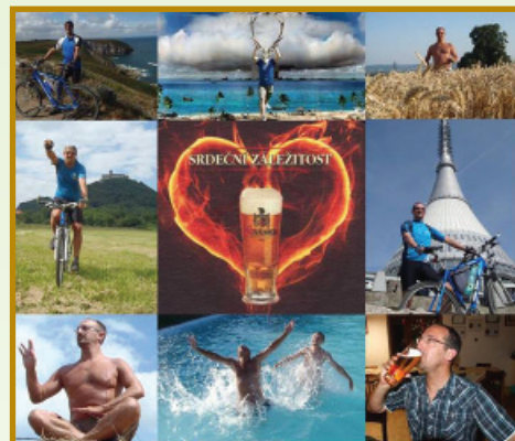
▲ AŽ JSTE KDEKOLI - SVIJANY NECHĚT VÁS PROVAŽÍ!