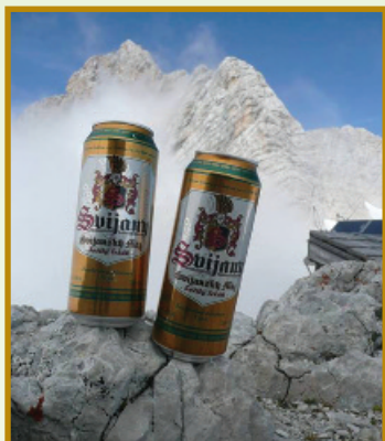
▲ zasilám pozdrav z Alp, kam jsem vzal své dva kamarády do 2745 m n. m. pod horu Dachstein :)

B. J.: Má nejoblíbenější značka, zrovna ho tu popjím na vaši počest, jste nejlepší! M. F.: Už se moc těšíme až v létě pojedem Jizeru. 100% se zase stavíme na supr pivečko a báječnou kuchyni přímo v pivovaru. Zrovna jsem si přivezl basičku Mázu na víkend R. K.: Vše Nej, díky za chutný mok, za chvíli s přáteli vyrazíme na vynikající "450". Jen tak dál !!!