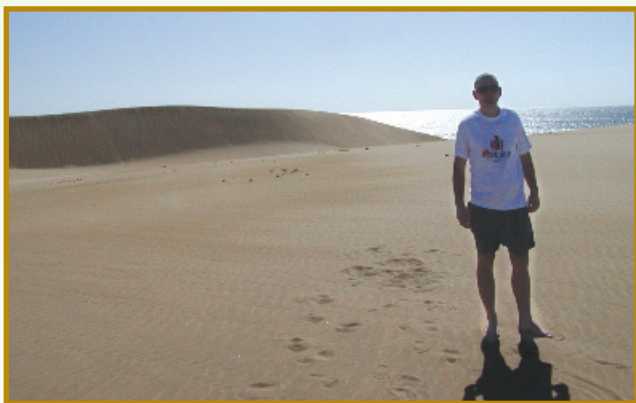
▲ nedávno jsem navštívil Gran Canarii a měl jsem v kufru přibalené vaše tričko. Posílám foto a pozdrav. Jinak Vám také děkuji, že vyrábíte tak skvělé pivo, jako jsou Svijany. Přeji příjemný den