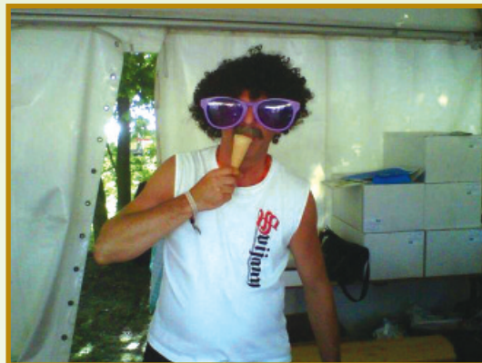
▲ Jedna ze slavností ... ochutnávka pívni zmrzky