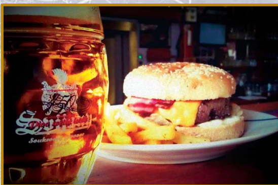
▲ Těto kombinaci se nedá odolat. Zdraví vás Teplice