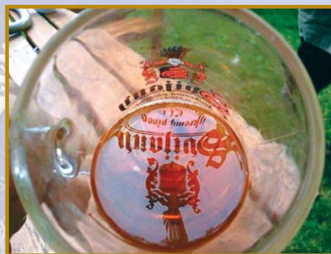
▲ víkendová momentka z chalupy