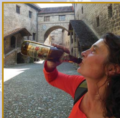
▲ Protože máme rádi vaše pivo, zejména pak Svijanského knížete, posíláme vám fotografii, jak váš "Kníže" dobyl hrad Burghausen. Domníváme se, že se to dosud žádnému šlechtici nepovedlo. :-)