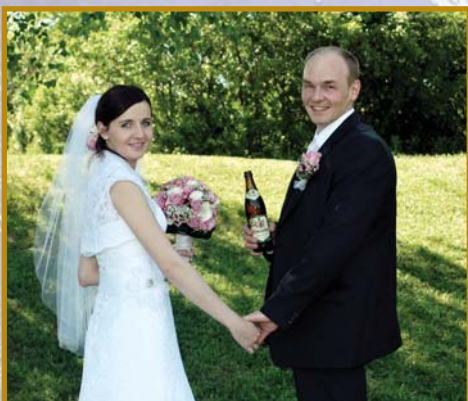
▲ Jako fanoušek Vašeho piva, vám posílám foto našeho velkého dne.

M. L.: Byl jsem na oslavách založení Vašeho pivovaru. Běžně vypiji max. 2 piva. U Vás jsem "450" vypil 6 kousků a moc jsem si pochutnal. Jedná se o skutečně vynikající pivo