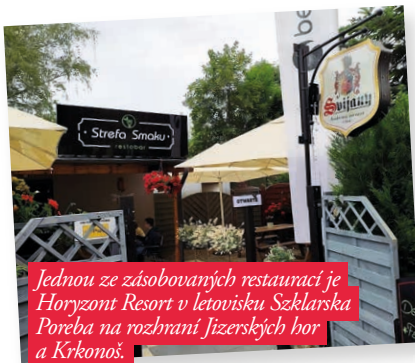
Jednou ze zásobovacích restaurací je Horyzont Resort v letovisku Szklarska Poreba na rozhraní Jizerských hor a Krkonoš.

Poláci mají speciální vztah nejen k českému pivu, ale také ke mně. A věří mi, že Svijany jsou to nejlepší pivo, jaké jsem kdy okusil. A právě to mě přivedlo ke spolupráci s pivovarem, takže nyní slávu svijanského piva se všemi našimi zaměstnanci šíříme po celém Polsku. ■