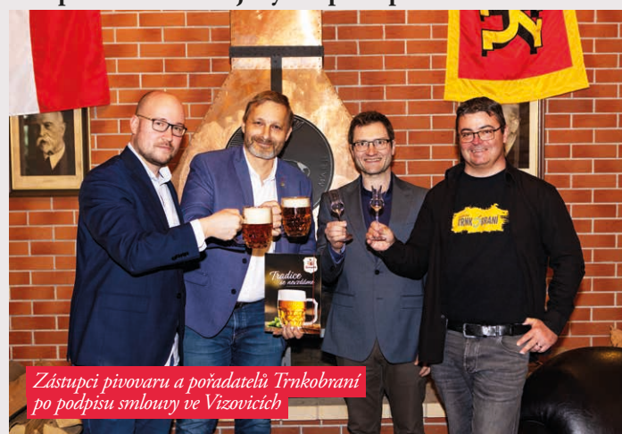
Zástupci pivovaru a pořadatelů Trnkobraní po podpisu smlouvy ve Vizovicích

Pivo a slivovice? Jistě, proč ne, ale všeho s mírou. ■