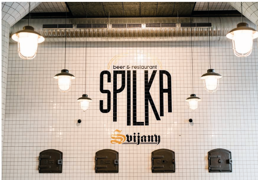
Bratislavská restaurace Spilka