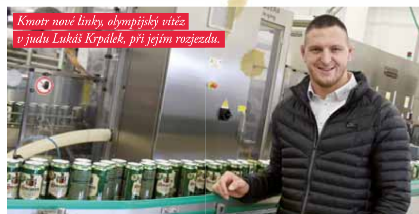
Kmotr nové linky, olympijský vítěz v judu Lukáš Krpálek, při jejím rozjezdu.

ný i budoucí nárůst poptávky po pivu v plechovkách. S jistým zpožděním za západní Evropou, kde se používají již od roku 1933, jsou plechovky z několika dobrých důvodů stále oblíbenější i u českých pivařů. Kromě toho, že nepropouštějí světlo a plyny, což je pro uchování kvality piva velmi důležité, jsou také velice skladné a pivo se v nich mnohem rychleji vychladí na správnou teplotu než pivo ve skleněné lahvi.