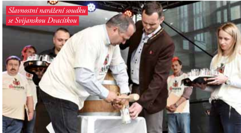
Slavnostní narážení soudku se Svijanskou Dvacítkou

Do nabitého programu netradičních sportů se mohli zapojit i hosté. Kulturní program obstarali DJs a skupina Kanci paní nadlesní. Večer završilo působivé vystoupení pole dance tanečnice mezi plameny. ■