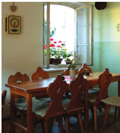
Na Pískovně: interiér vyzdobený dobovými fotografiemi a poklady, které se našly na půdě

Příjemná atmosféra jako u babičky, interiér vyzdobený dobovými fotografiemi a poklady, které se našly na půdě, tak by se dala ve zkratce charakterizovat rodinná Hospůdka Na Pískovně. Malebná restaurace na Vysočině však nabízí víc než jen domácí prostředí s puncem nostalgie. V roce 2012 byla otevřena v podobě výdejního okýnka do zahrady, ale postupně se rozrůstala a rozšiřovala své služby. Dnes se může pochlubit především tradičními českými jídly podávanými nejen během svátečních dní a poctivým svijanským pivem, které si odhlasovali sami hosté. „Poté, co je naši štamgasti mohli vyzkoušet, rozhodli jsme se jednoznačně pro Svijany, což se nám také osvědčilo. Na základě vzrůstající obliby tohoto zlatého moku jsme pro věrné hosty dokonce zorganizovali zájezd přímo do Svijan,“ říká Jana Čermáková, majitelka restaurace. Nejvíce se zde pije Zámecký Máz, od jara do podzimu sortiment doplňuje Svijanská Kněžna a Vozka. Během víkendů je nabídka rozšířena také o speciály. Kromě gurmánských zážitků láká restaurace, jejíž