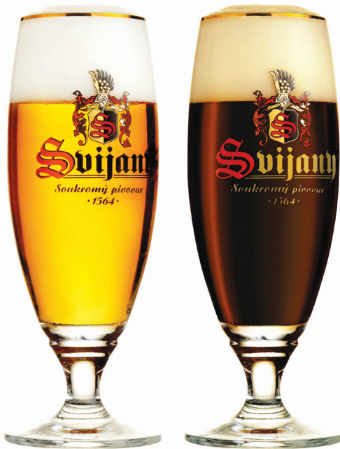
Knížka + Kněžna: vynikající samostatně i jako ideální řezaná kombinace

Svijanský Knížka 13 % je silnější sváteční pivo, vyráběné tak, aby ještě více vynikly chutě a vůně typické pro ležáky. Je nejstarší ze všech speciálů – pivovar jej vaří již od poloviny devadesátých let – a patří také k nejoblíbenějším: tvoří téměř polovinu celkového výstupu speciálních piv ve Svijanech. Vyznačuje se příjemně hořkou a plnou chutí. Jeho tmavý protějšek, Svijanská Kněžna 13 % , se vyrábí z vybraných speciálních sladů, které mu dodávají specifickou kávově-karamelovou chuť. Ve Svijanech se vaří od roku 1999. Výborně se hodí k dobrému jídlu a mimořádnou oblibu si získala jako součást řezaného piva s kterýmkoli jiným pivem ze Svijan – různými kombinacemi lze dosáhnout jiné chutě, vůně a stupňovitosti. Výborně si v tomto směru Kněžna rozumí právě se Svijanským Knížetem.